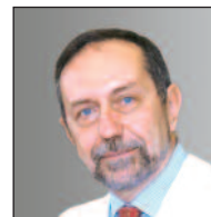
Prof. Maurizio Puttini

Cari amici e colleghi, è con grande piacere che vi invitiamo al prossimo congresso della nostra Società, la SICVE, che si terrà a Milano dal 27 al 30 settembre 2009. Erano diversi anni che Milano non ospitava un evento così importante e questo per noi è motivo di soddisfazione e compiacimento.